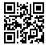
↑スマホはこちらから